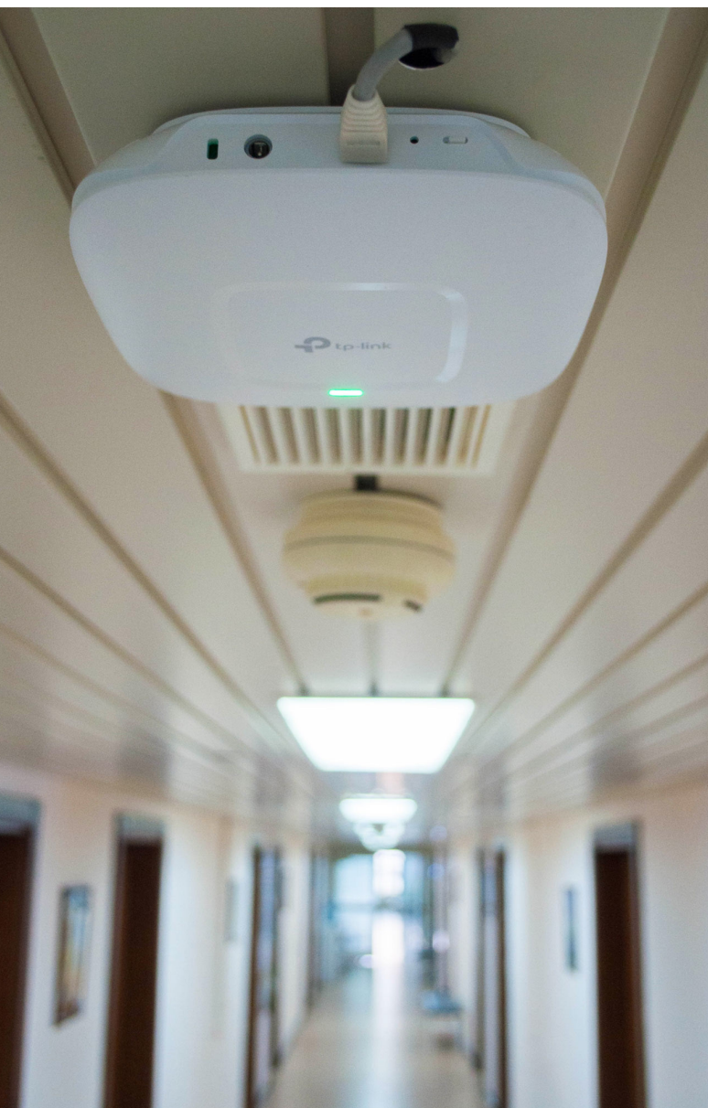
Установленная точка доступа CAP1200 в отделении ОКБ №1

Нашим партнером, компанией « Первый интегратор », было проведено радиообследование, затем была составлена детальная схема покрытия, осуществлены необходимые расчеты и выбрано решение в требуемом ценовом сегменте.