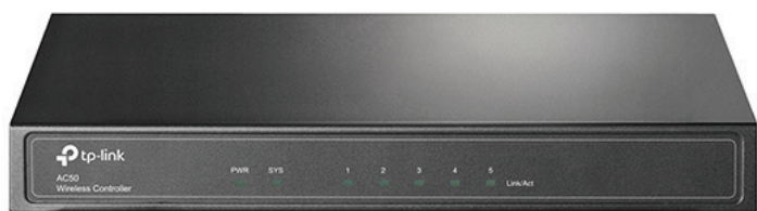
Wi-Fi контроллер AC50

В данном проекте было решено использовать следующее оборудование TP-Link: Wi-Fi контроллер AC50, позволяющий централизованно управлять и проводить мониторинг всех точек доступа в больнице, и точки доступа CAP1200, которые в связке с контроллером позволяют реализовать покрытие сетью Wi-Fi. Также отметим технологию Fast roaming, благодаря которой медицинский персонал при обходе пациентов может автоматически переключаться между точками доступа с наилучшим сигналом без необходимости ручного переключения между ними, и технологию MU-MIMO, позволяющую обеспечить скорость передачи данных до 1200 Мбит/с одновременно множеству пользователей.