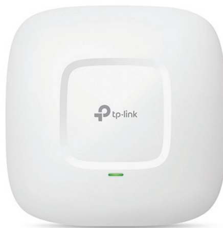
Гигабайтная потолочная точка доступа CAP1200

Благодаря Wi-Fi решению от TP-Link в Областной Клинической Больнице №1 появился отдельный доступ в интернет для пациентов больницы, а также корпоративная беспроводная Wi-Fi сеть, что позволит в дальнейшем реализовать концепцию Smart-медицины. Решение, которое было придумано партнером «Первый интегратор» легко масштабируется, и в перспективе это позволит интегрировать его в других отделениях больницы. Также в проекте была реализована отдельная аутентификация для сотрудников больницы и пациентов в соответствии с Постановлением Правительства РФ № 758 от 31 июля 2014 года.